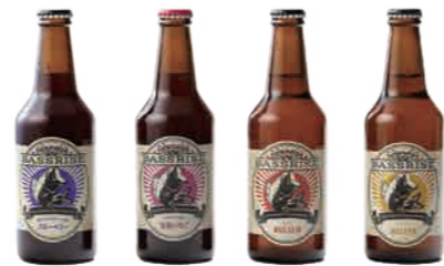
ブルーベリー 完熟いちご ケルシュ ヴァイツェン